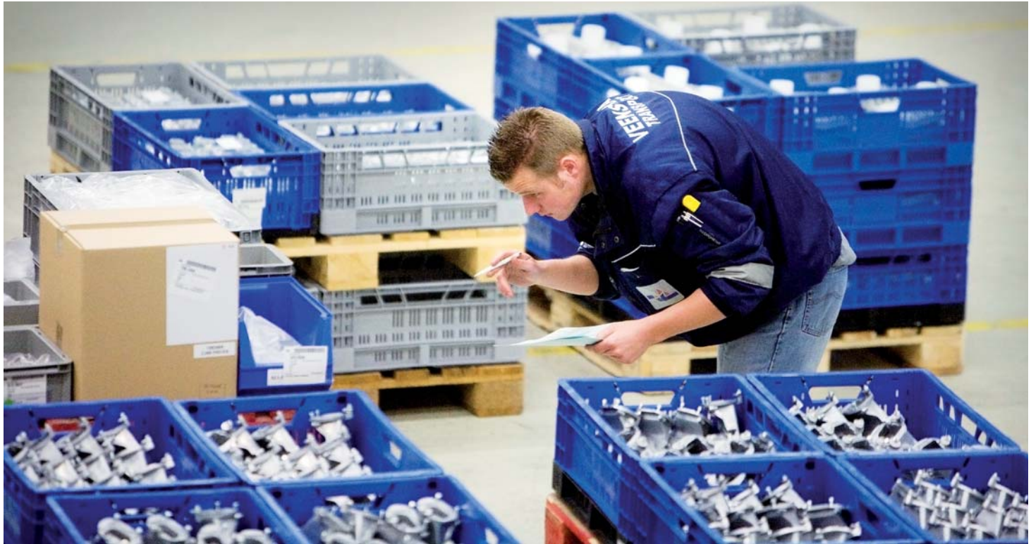
Betrokkenheid geeft betere dienstverlening.

succes. We hebben een heel slanke organisatie met een platte structuur en het is net als met die kaasreclame: wat er niet aanzit, hoeft er ook niet af. In moeilijke perioden heb je extra veel profijt van een slanke organisatie want er zijn geen onproductieve afdelingen waarin je moet gaan snoeien.'